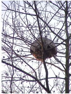
Nid de frelons asiatiques aux lagunes